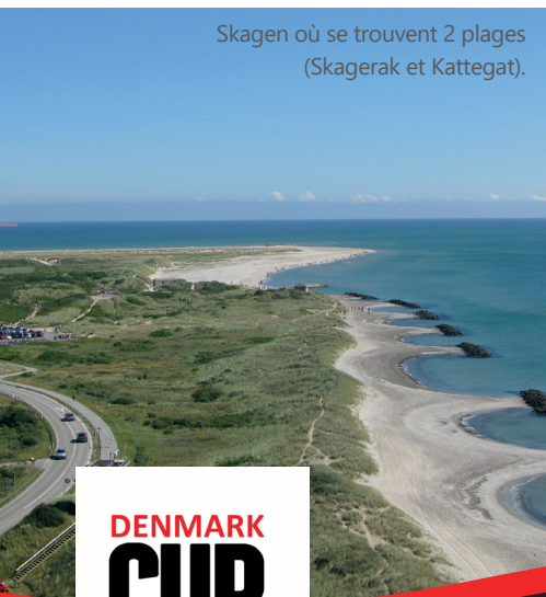
Skagen où se trouvent 2 plages (Skagerak et Kattegat).